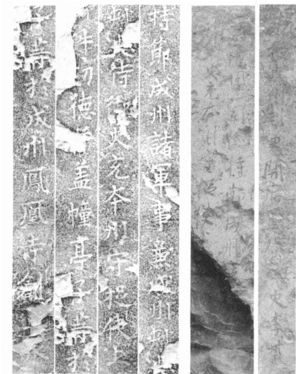
《经幢》与《题壁》职官称谓比较