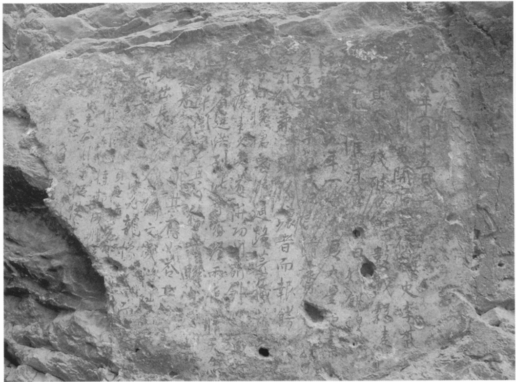
图版16 《李叔政题壁》墨迹