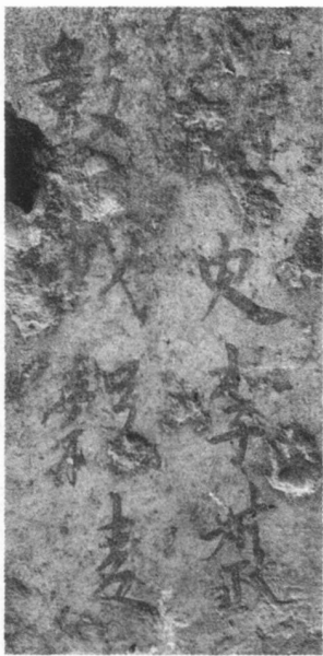
图1 《题壁》中的“李叔政”

李叔政,史籍无载,由题壁知,李叔政作为御史台成员之一的侍御史,于元和八年(813)六月十五日出任成州刺史,其官阶至开府仪同三司,或称开府,品级从一品,为最高级别之阶官 [31] ,并“使持节成州诸军事” [41] 。成州刺史一职,之所以用高官兼任,这大概因为与成州特殊的地理位置有关。