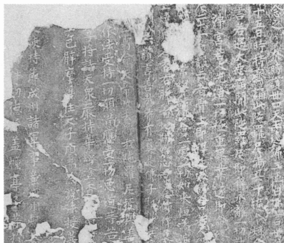
图3 《尊胜陀罗尼经》八棱幢拓片局部